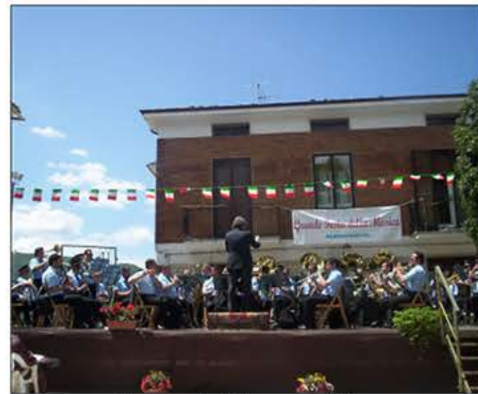
Un momento della scorsa edizione del Concerto della Banda di Conversano