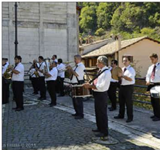
La Banda di Monteroduni